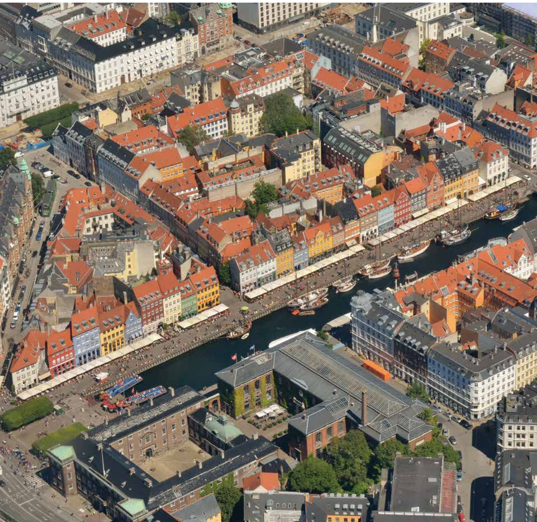
Bairro Nyhavn em Copenhaga, Dinamarca - vista aérea.